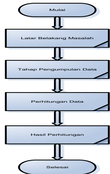
Gambar 2. Kerangka Pikir Peneliti

Bagan ini berdasarkan kerangka atau gambaran penelitian yang dibahas didalamnya bertujuan untuk mempermudah peneliti dan pembaca dalam memahami dan membaca jurnal ini.